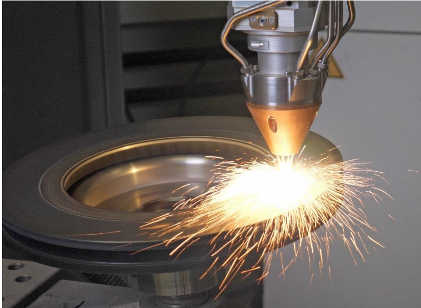
Bild 1: Pulverbasierte Laserbeschichtung einer Bremsscheibe.

Bremsscheiben für KFZ, Busse, LKW oder Schienenfahrzeuge. Realisiert unter Einsatz infraroter Diodenlaser, verbinden die Beschichtungen Abrasions- und Korrosionsschutz und senken die Feinstaubentwicklung. Wie üblich stellt Laserline seine Systemlösungen am Messestand auch mithilfe von Videos und animierten Darstellungen vor. Die Ergebnisse der jeweiligen Materialbearbeitungen werden durch verschiedene Bauteilmuster demonstriert.